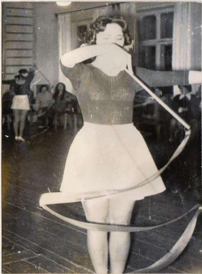
УПРАЖНЕНИЕ С ЛЕНТОЙ