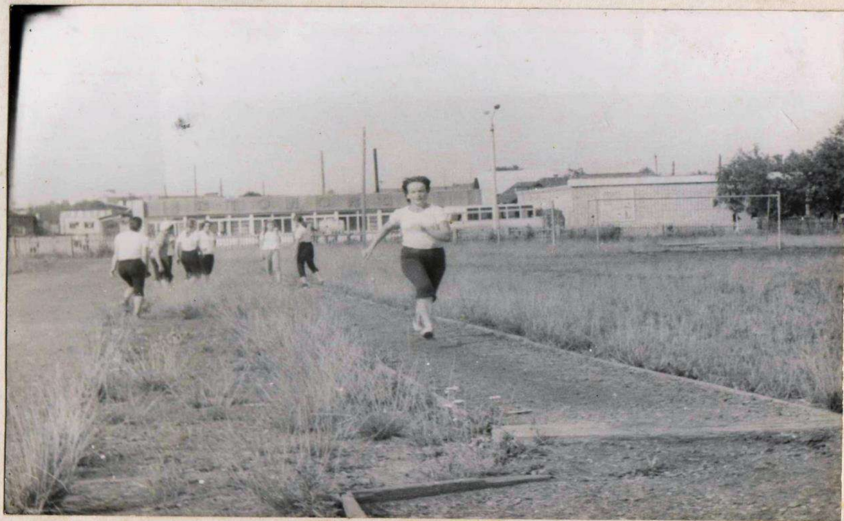
СПАРТАКИАДА СПОРТИВНОГО ЛАГЕРЯ