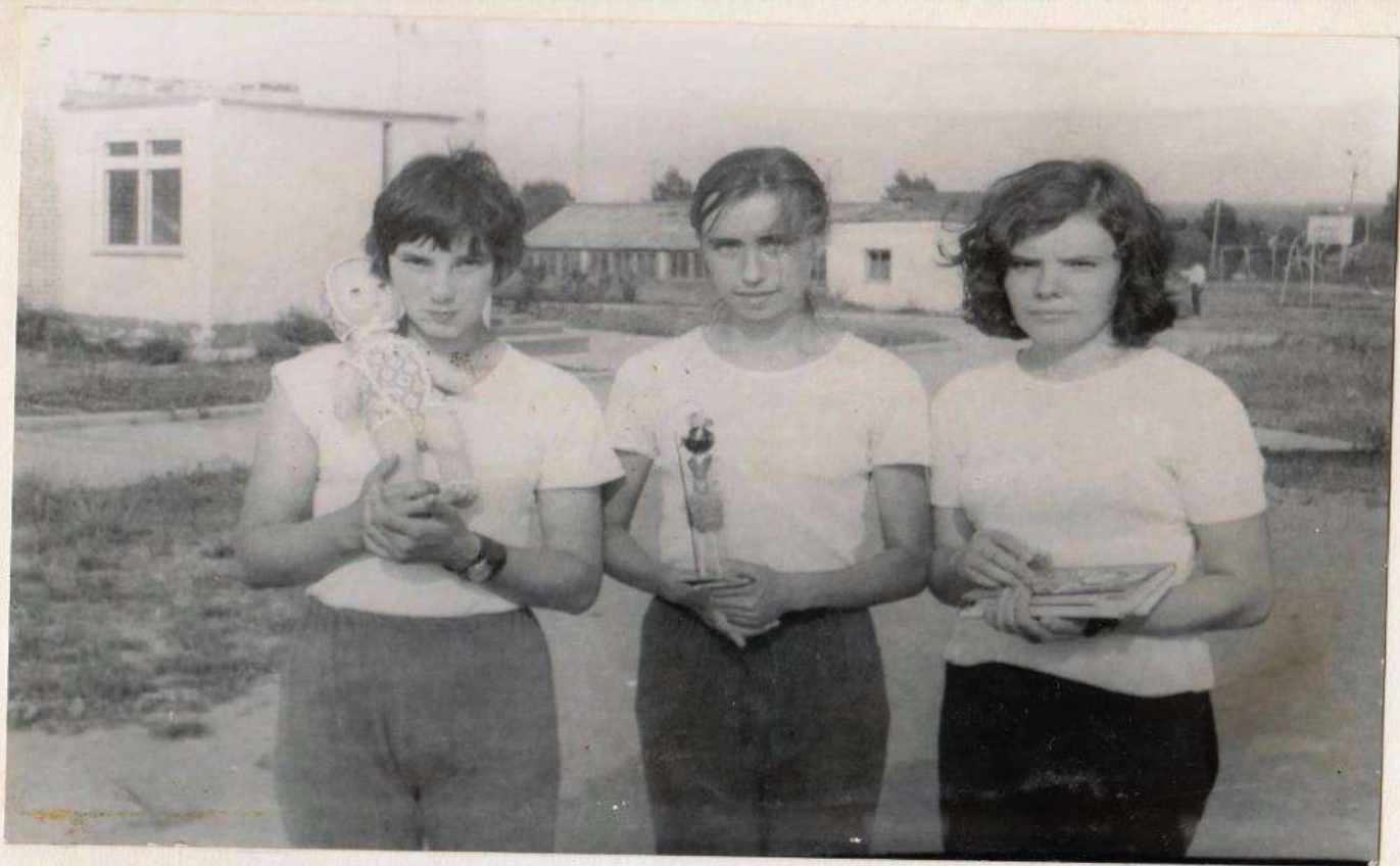
ПРИЗЕРЫ ЛЕГКОАТЛЕТИЧЕСКОГО МНОГОВОРЬЯ