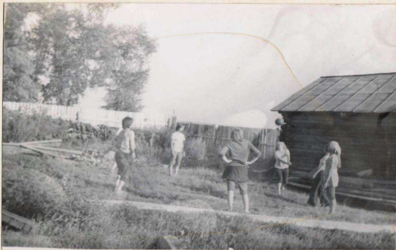
В СВОБОДНОЕ ВРЕМЯ