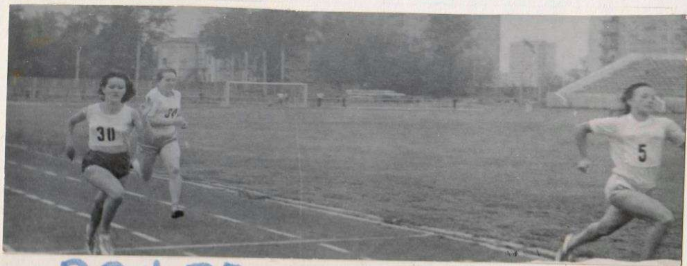
ЗОНА РСФСР - БЕГ 100 МЕТРОВ