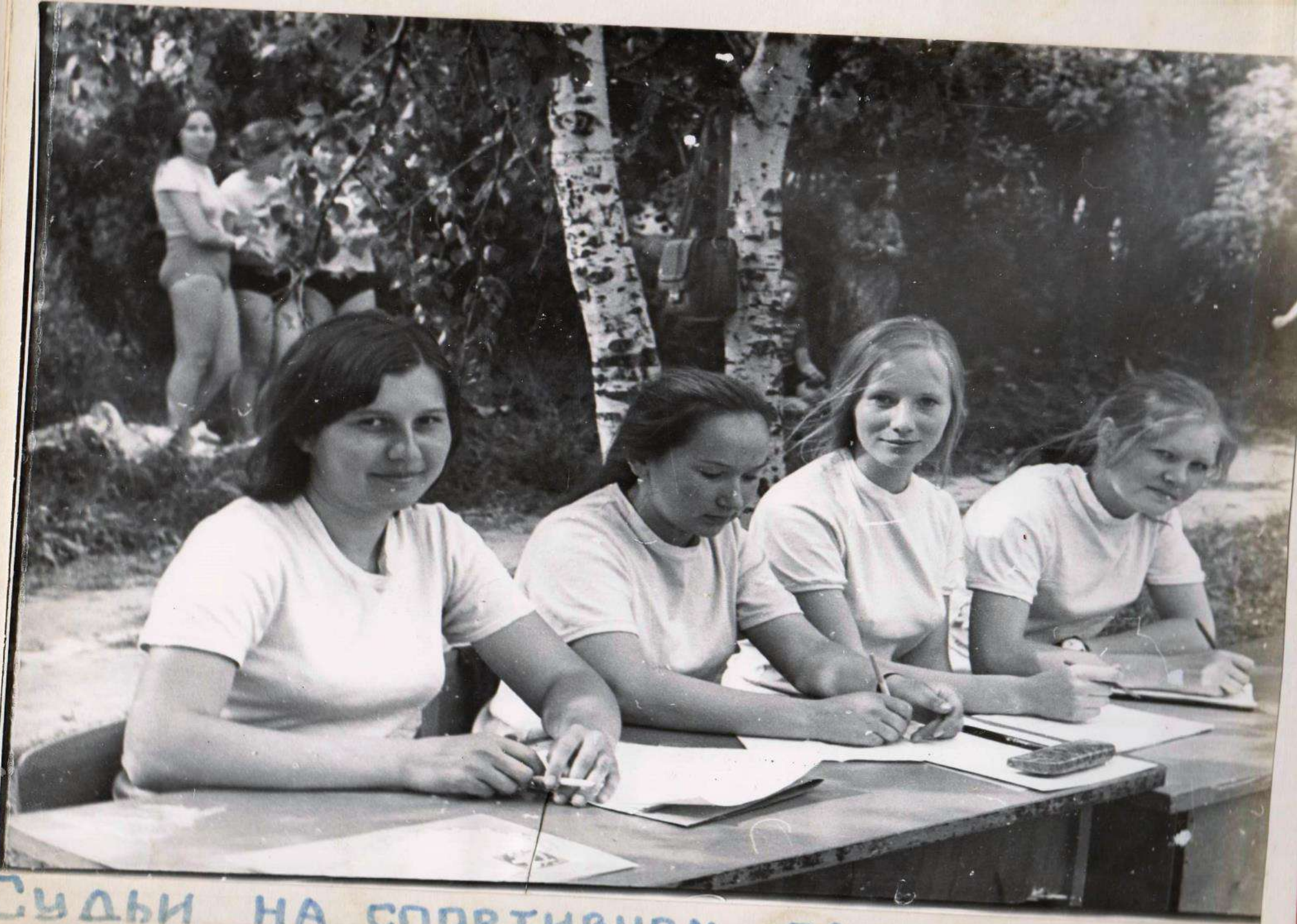
Судьи на спортивном празднике