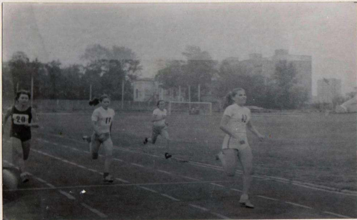
Зона РСФСР - БЕГ 400 МЕТРОВ