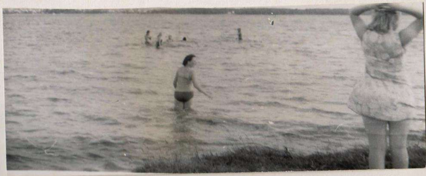
КУПАНИЕ И ЗАГОРАНИЕ